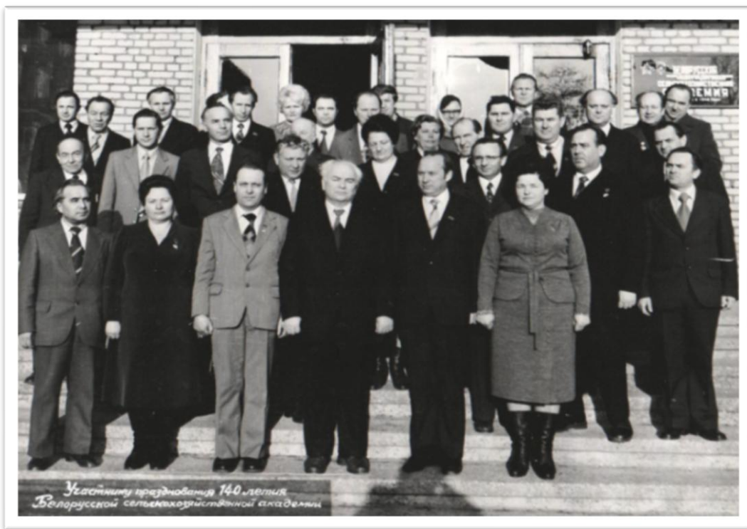
Герои Социалистического Труда среди профессорско-преподавательского состава на праздновании 140-летнего юбилея БСХА.