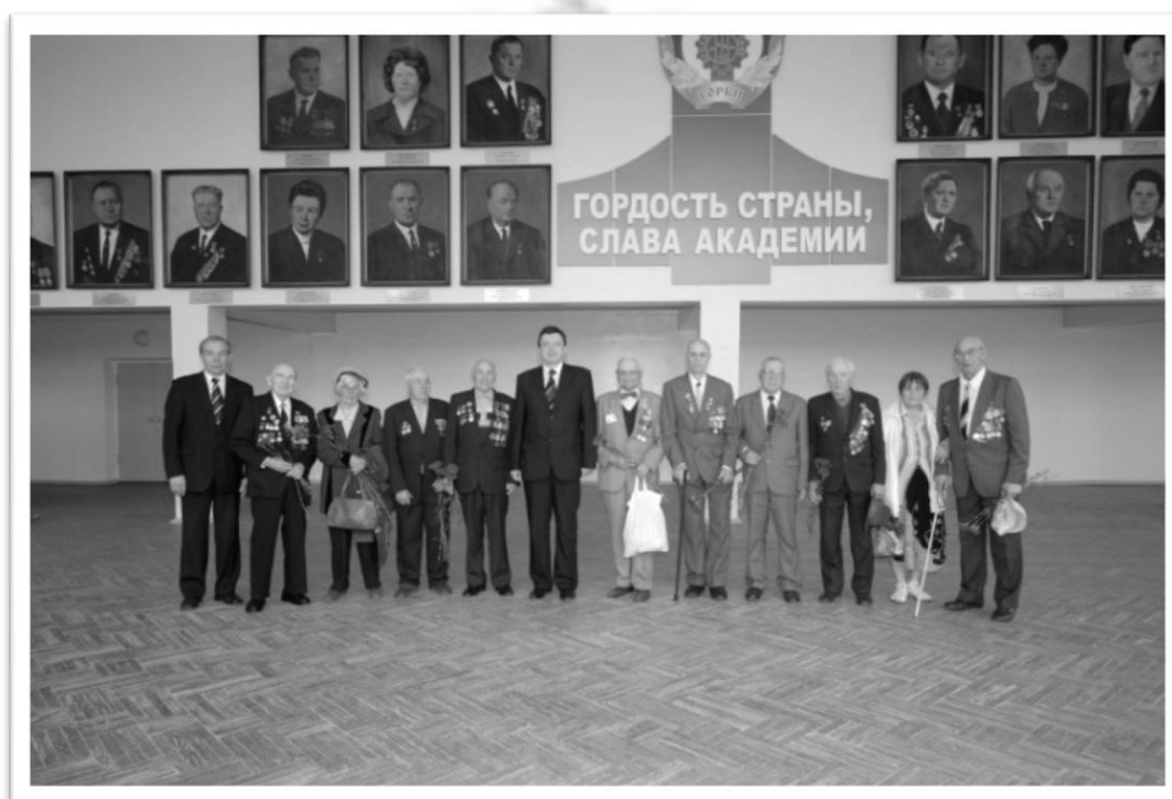
Ветераны Великой Отечественной войны и ректор академии под портретной галереей Героев Социалистического Труда «Гордость страны, Слава академии».