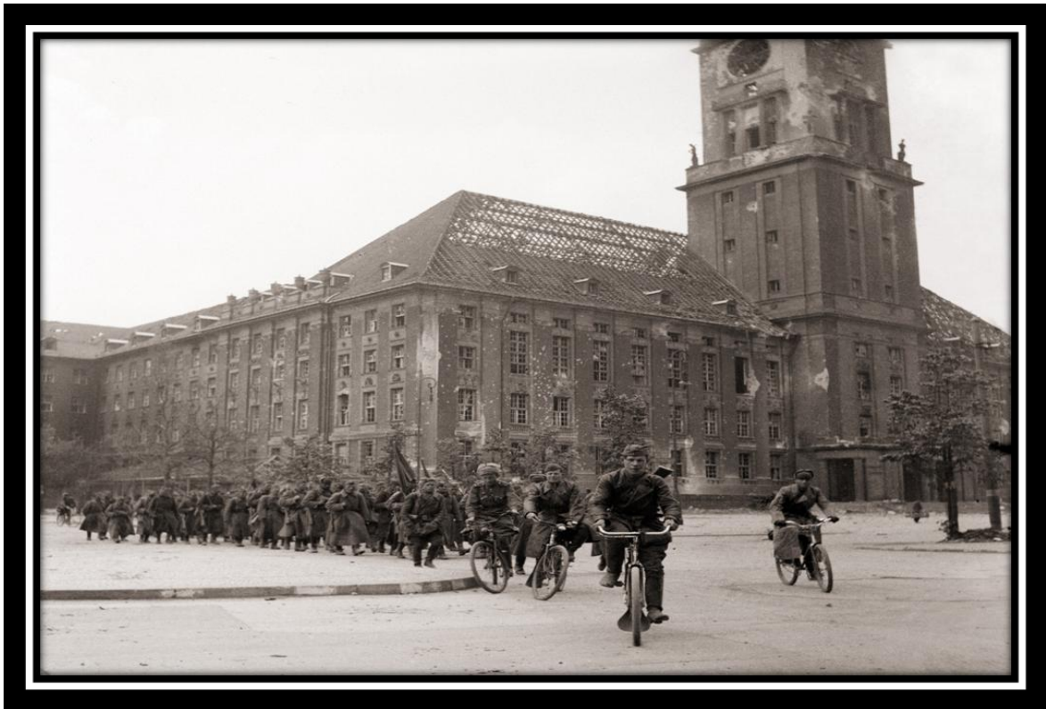
Выступаем из Берлина на помощь восставшей Праге. 544 стрелковый полк на марше возле берлинской ратуши. 2 мая 1945 г.