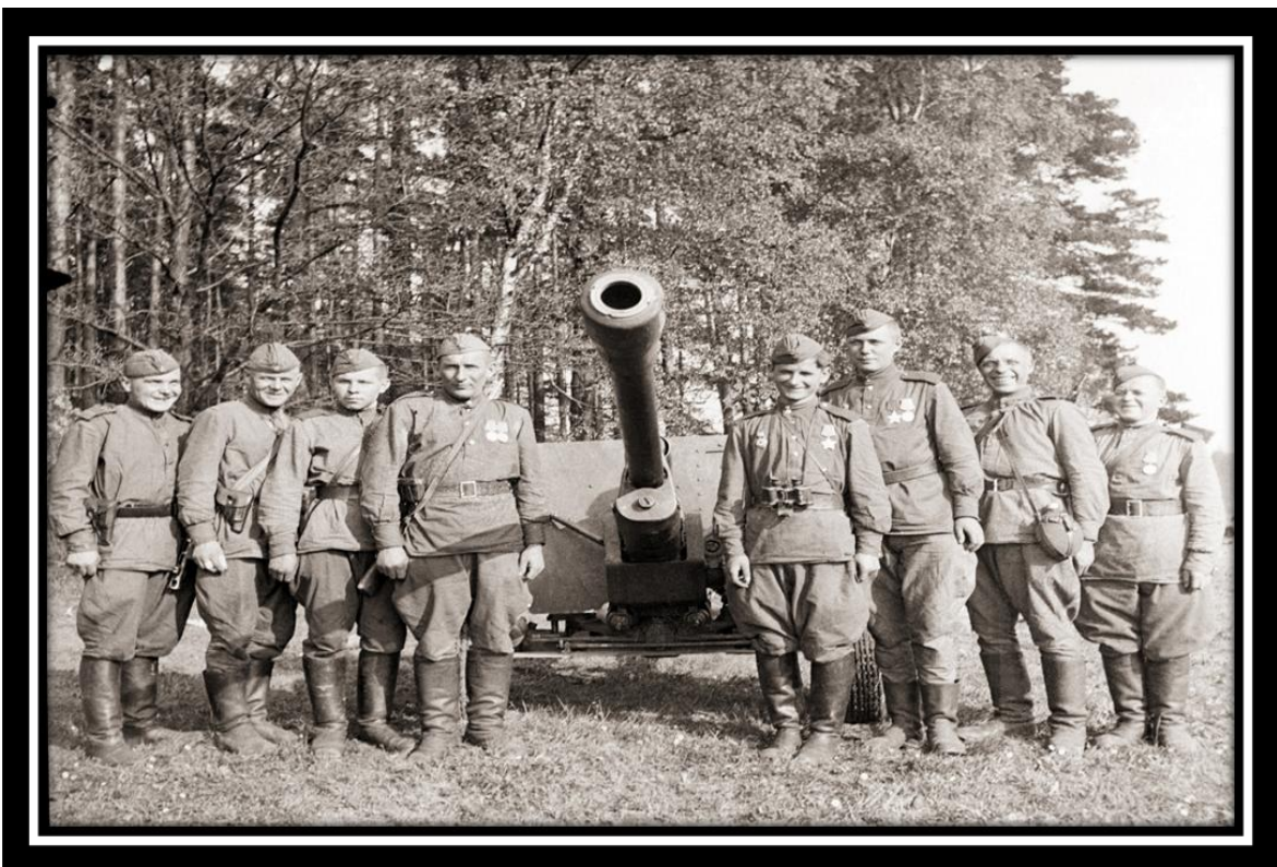
Расчет 76-ти мм орудия 544-го стрелкового полка отличившихся в боях за Берлин. Май, 1945 г.