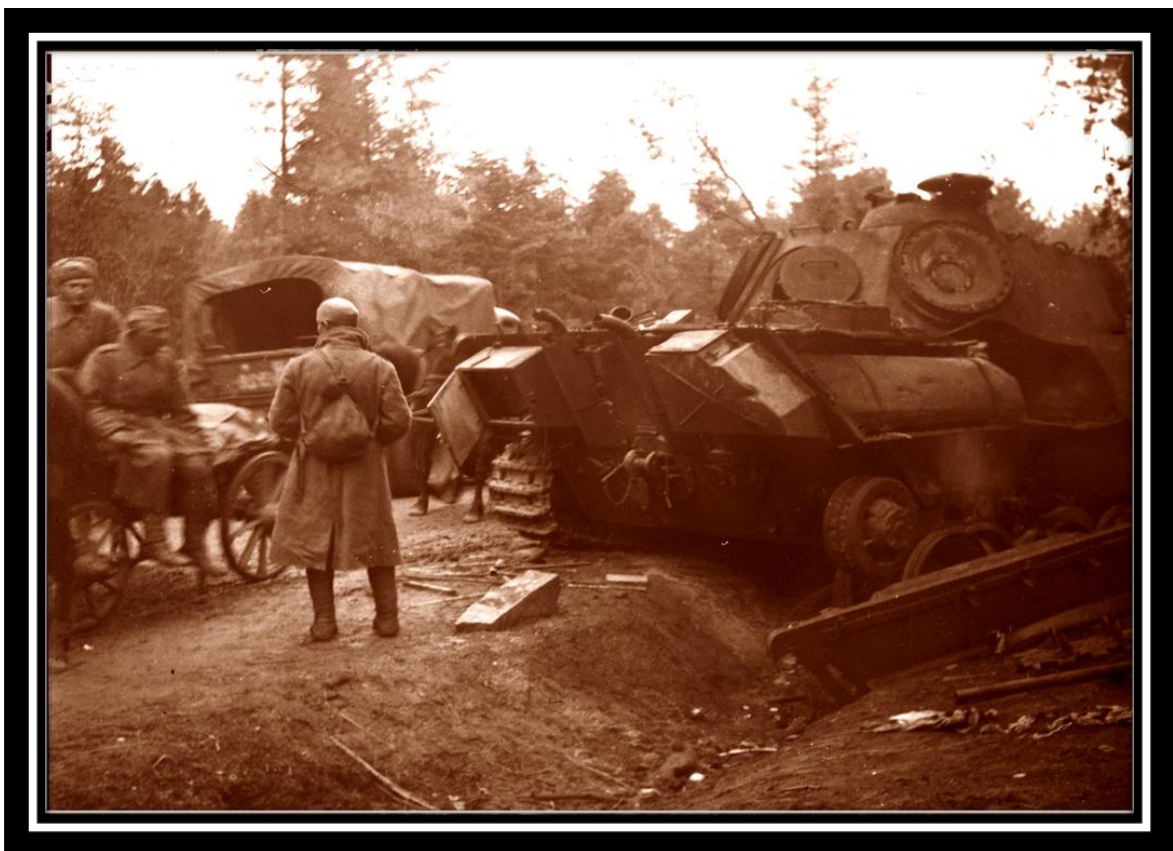
Последние дни войны. Берлин, 1945г.