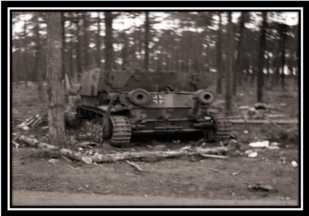
Последние дни войны. Берлин, 1945 г.