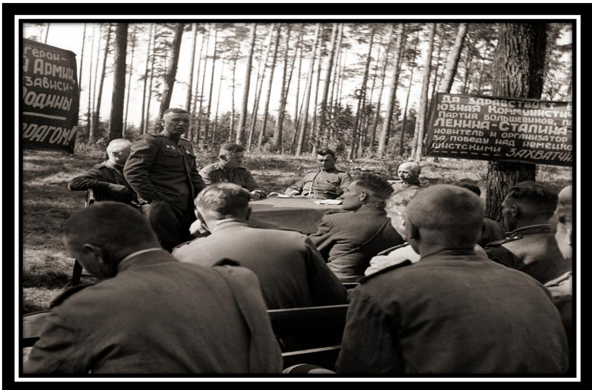
Собрание коммунистов 544-го стрелкового полка перед наступлением на Берлин. Апрель, 1945 г.