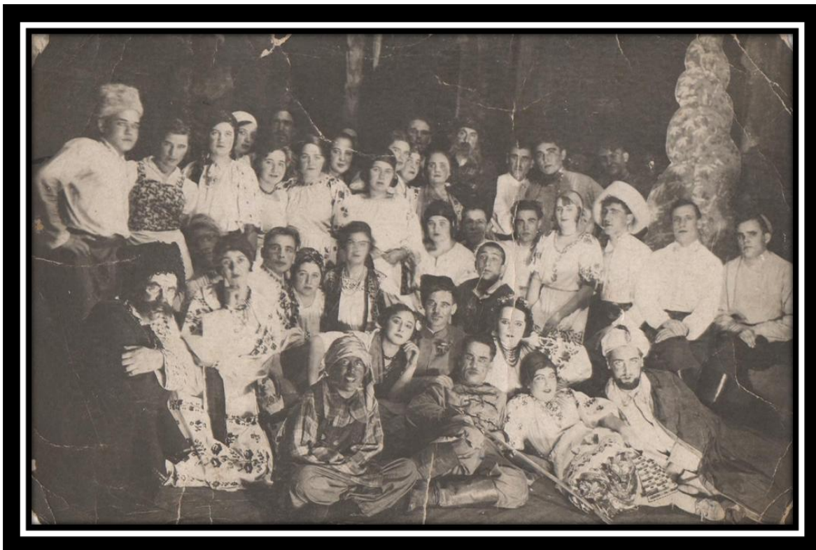
Участники оперы Гулак-Артемовского «Запорожец за Дунаем», Горки, 1941