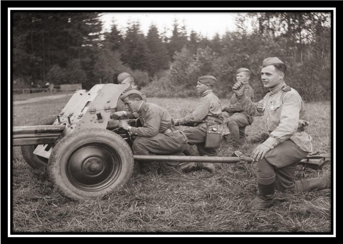
Последние дни войны. Берлин, 1945 г.