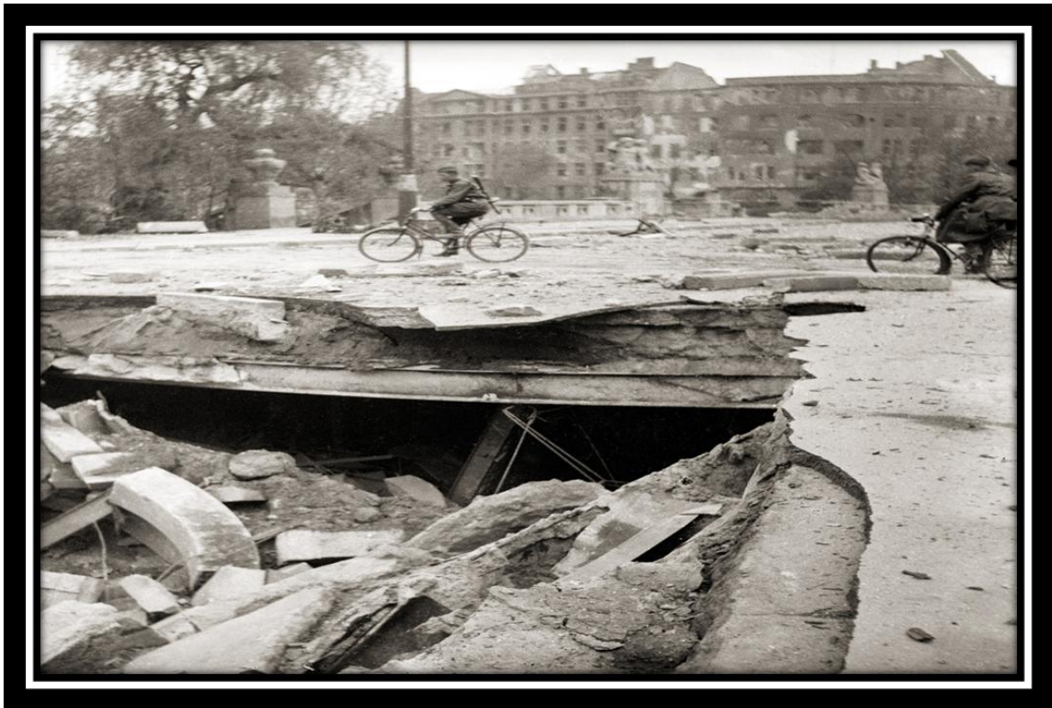
Берлинское метро, 1 мая 1945г.