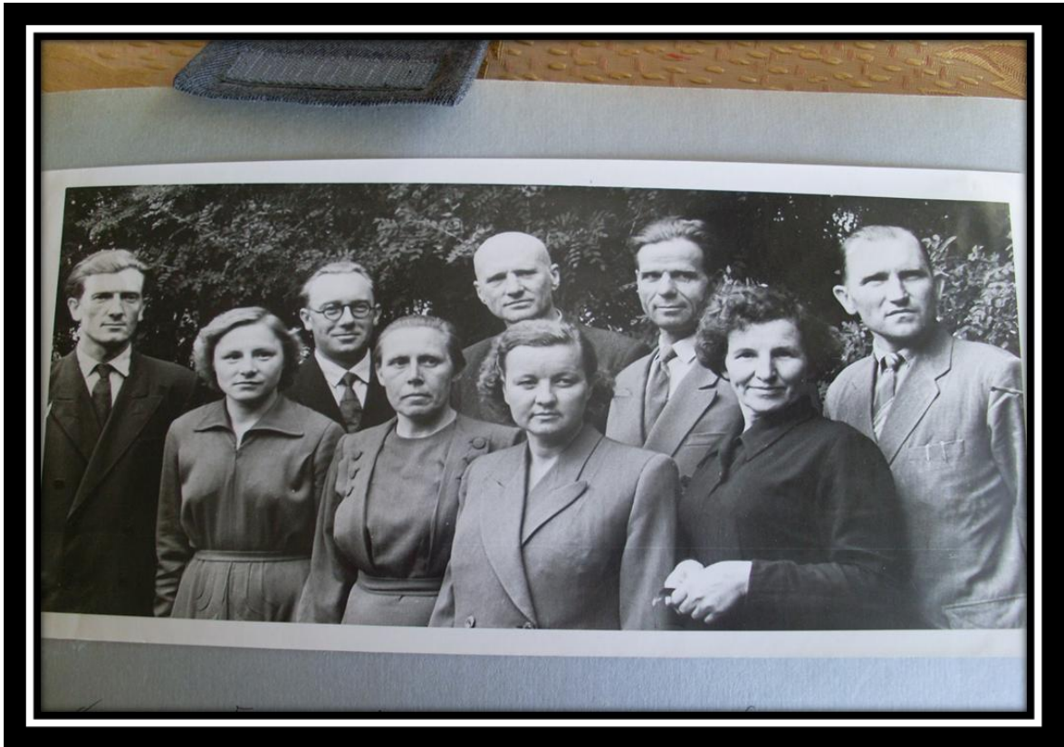
Сотрудники Гродненской областной государственной сельскохозяйственной опытной станции. Щучин, 1960 г.