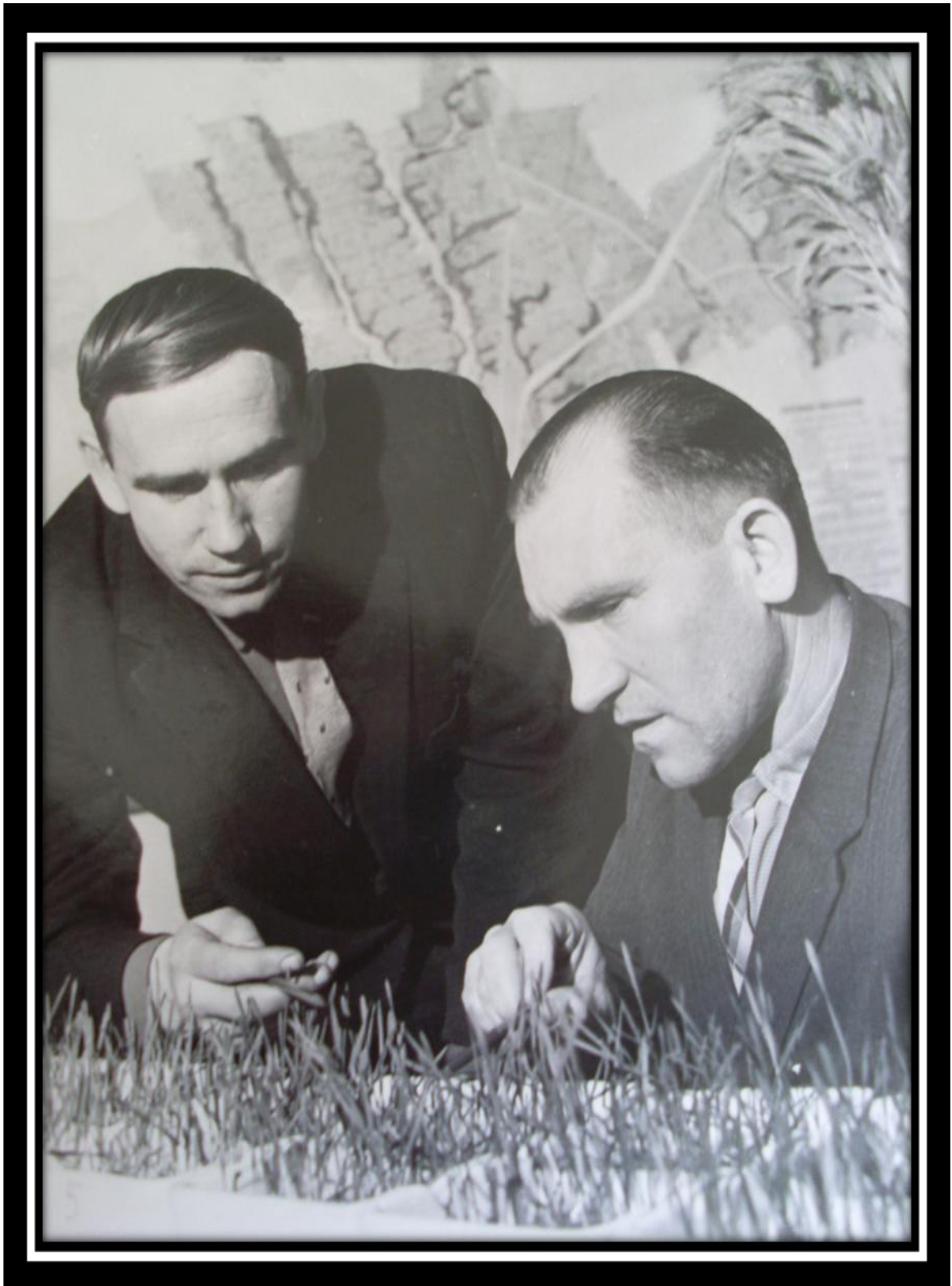
Опыты на всхожесть ржи. Щучин, 1950 г