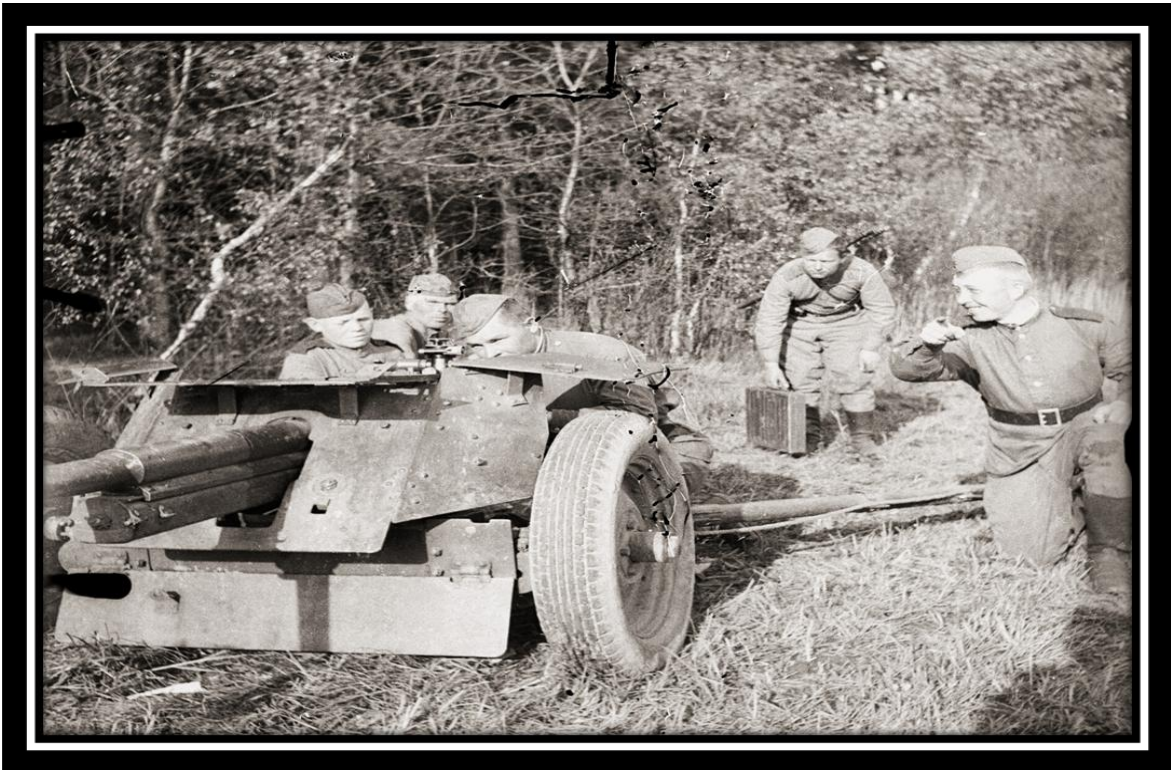
Расчет 45-ти мм орудия 544-го стрелкового полка бьет прямой наводкой по танкам противника. Апрель, 1945 г.