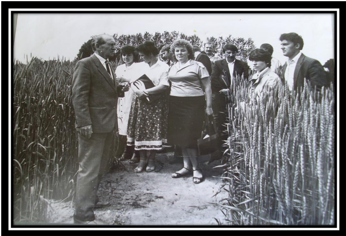
Опытное поле . Горки