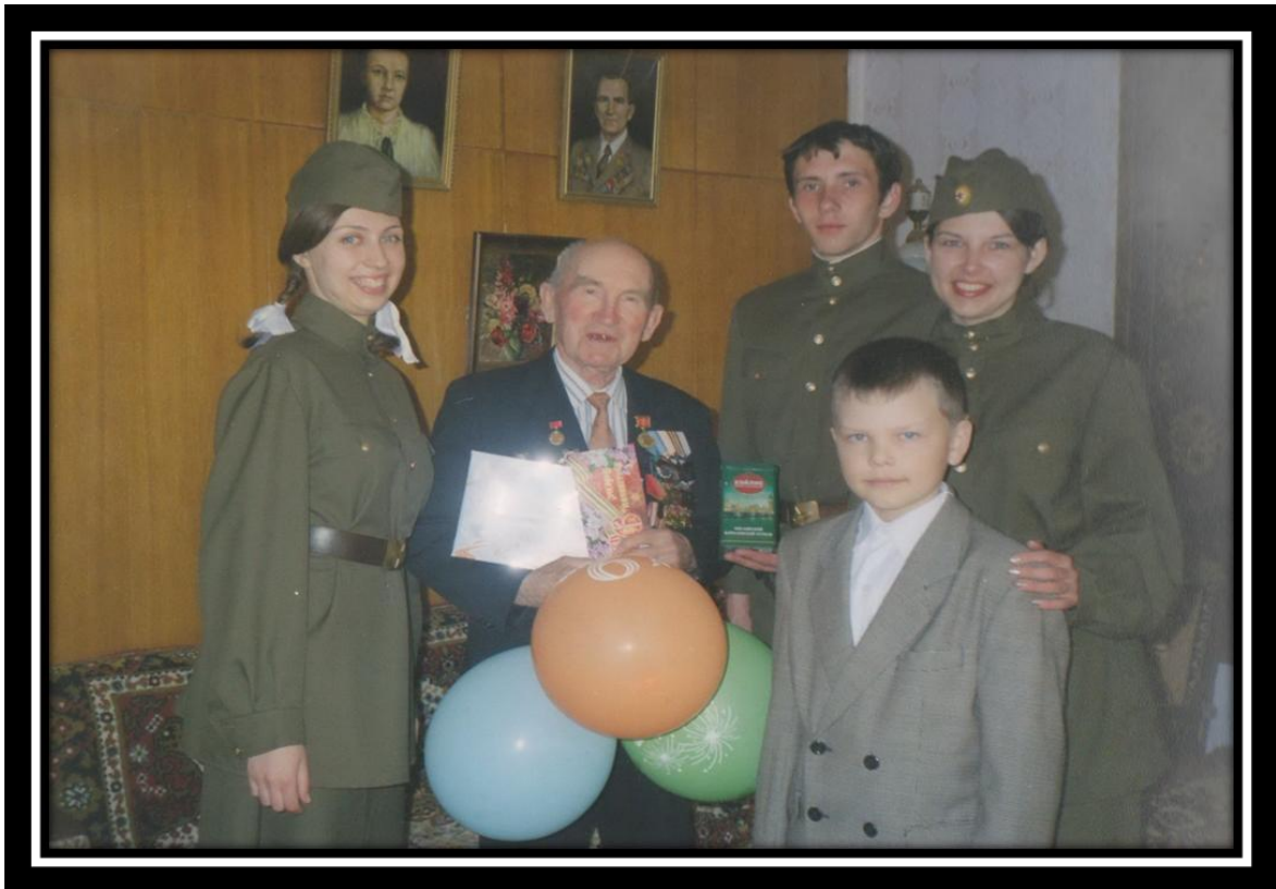
Акция «Спасибо деду за Победу»