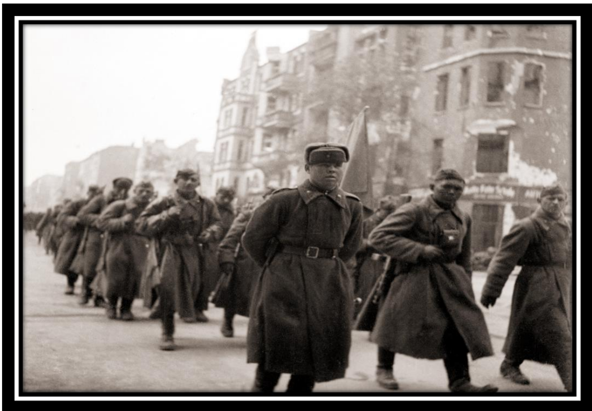
Последние дни войны. Берлин, 1945 г.