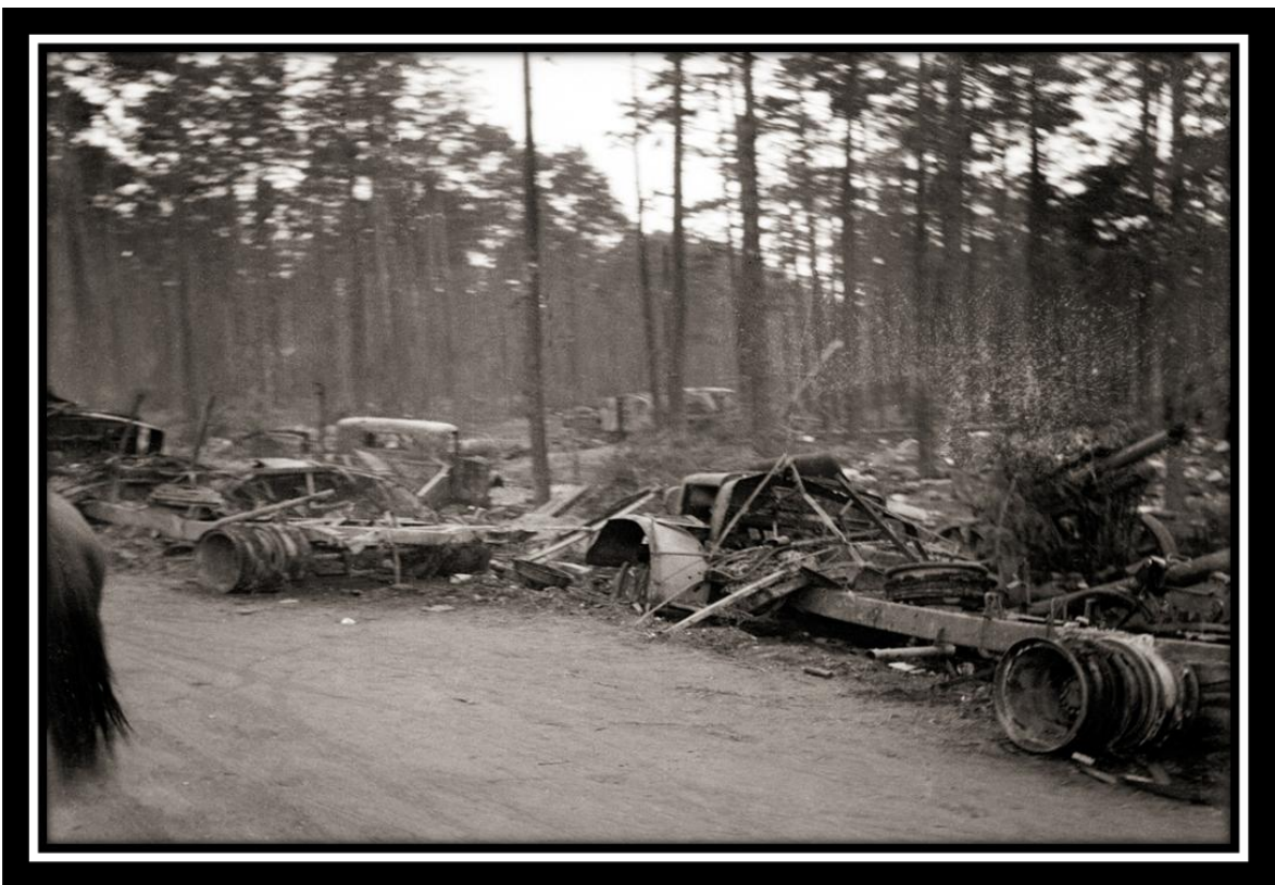
Последние дни войны. Берлин, 1945 г.