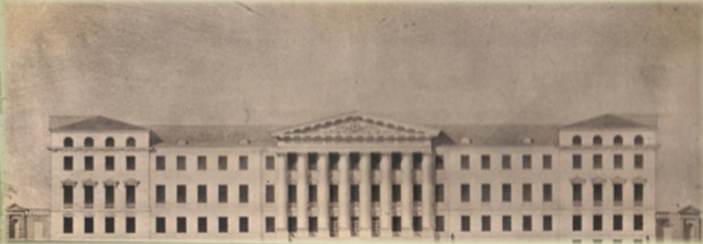
ПРОЕКТ ВОССТАНОВЛЕНИЯ И РЕКОНСТРУКЦИИ КОРПУСА №4 Архитектор Н. Морозов. 1950 год