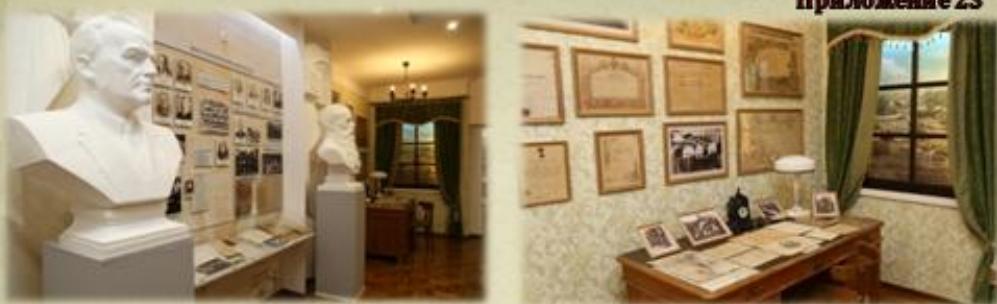
ФРАГМЕНТЫ ЭКСПОЗИЦИИ В МУЗЕЕ АКАДЕМИИ