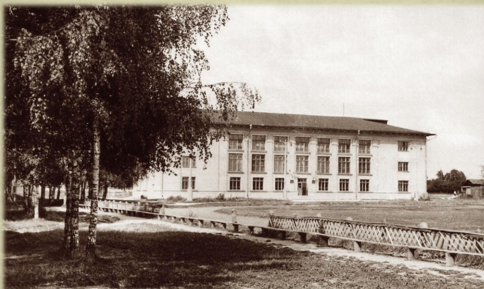
СПОРТИВНЫЙ КОМПЛЕКС АКАДЕМИИ Построен в 1960 году