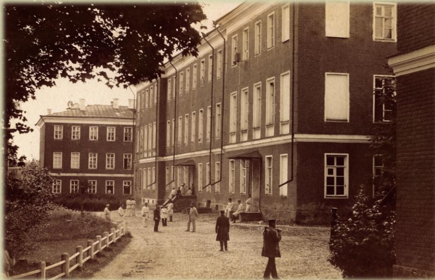
ГОРКИ. ГЛАВНЫЙ КОРПУС ГОРЬГОРЕЦКОЙ ЗЕМЛЕДЕЛЬЧЕСКОЙ ШКОЛЫ Фото начала XX в.