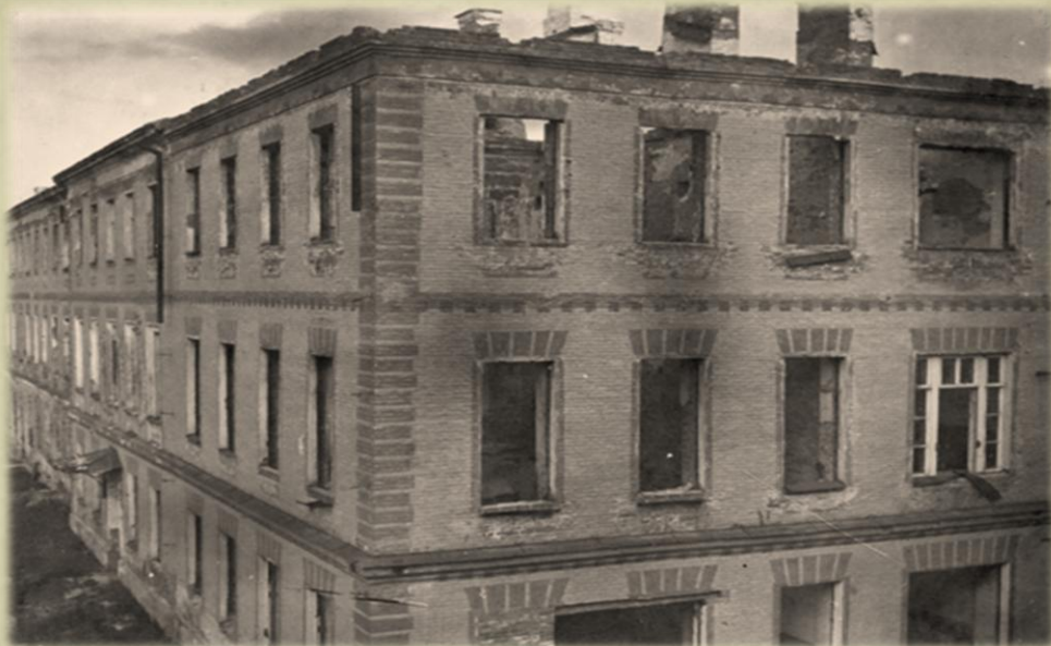
УЧЕБНЫЙ КОРПУС № 4 Корпус сильно пострадал в годы Великой Отечественной войны (1941-45 гг.), разрушения были оценены в 92%