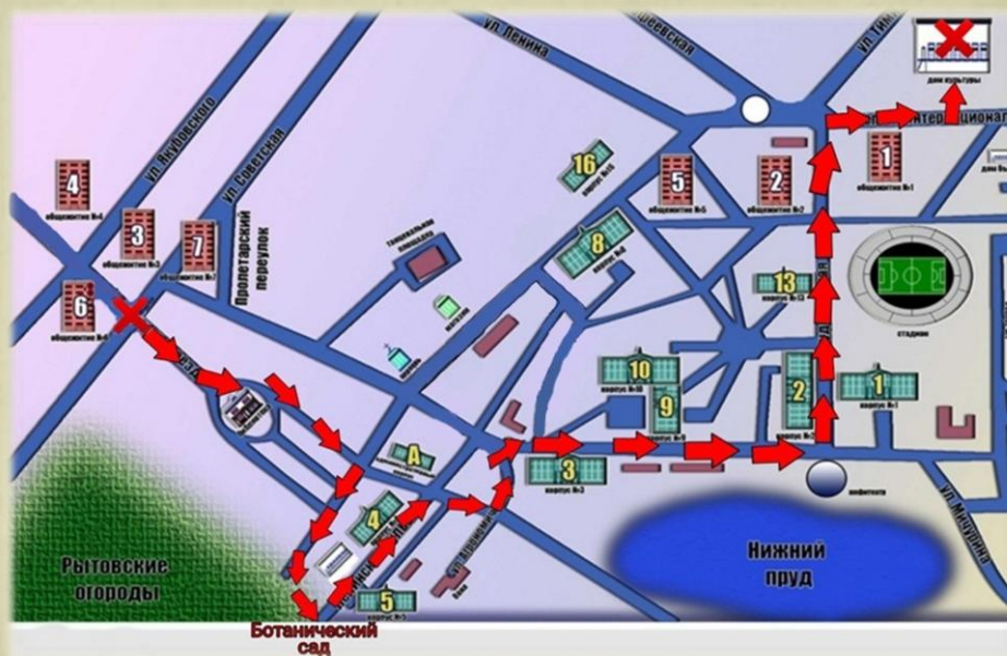
ПЛАН ЭКСКУРСИОННОГО МАРШРУТА ПО АКАДЕМИЧЕСКОМУ ГОРОДКУ