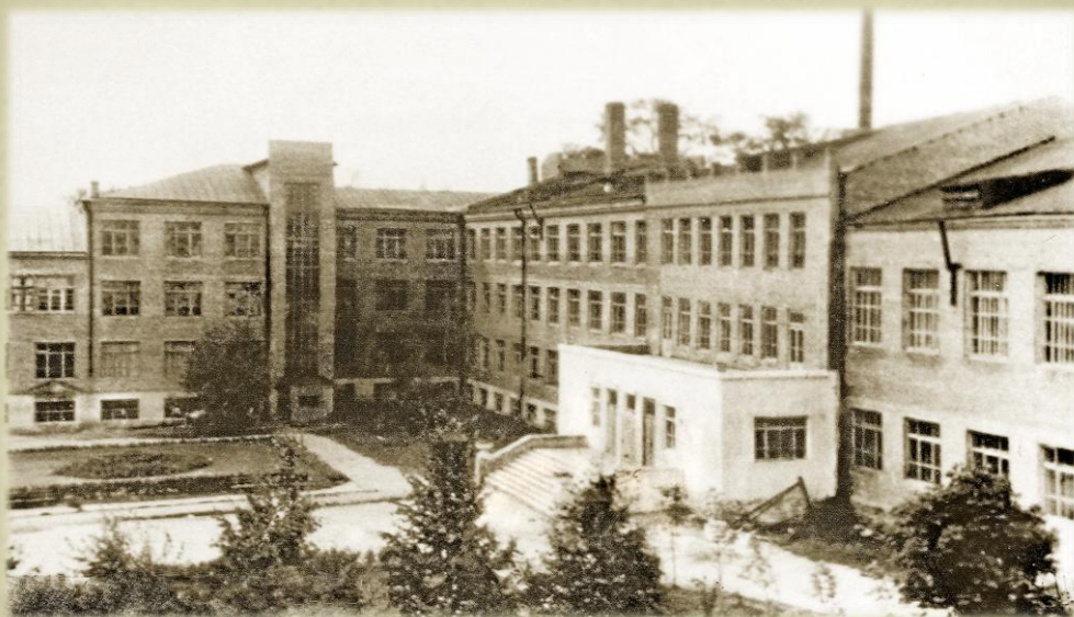
УЧЕБНЫЙ КОРПУС № 1 Построен в 1936 году