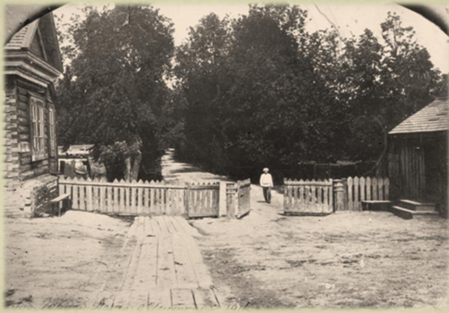
«КРУТЯЩИЕСЯ ВОРОТА» Фото 1916 года