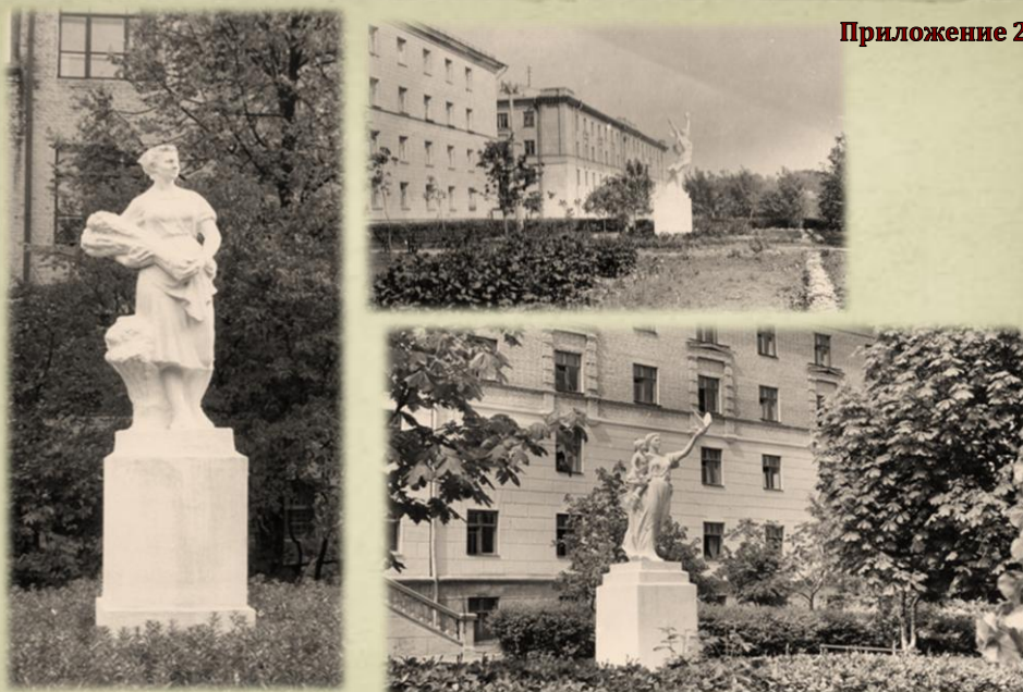
СКУЛЬПТУРНЫЕ КОМПОЗИЦИИ УСТАНОВЛЕННЫЕ ПЕРЕД ОБЩЕЖИТИЯМИ АКАДЕМИИ В 50-ЫХ ГОДАХ XX ВЕКА