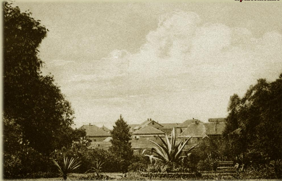
ГОРКИ. БОТАНИЧЕСКИЙ САД Фото начала XX в.