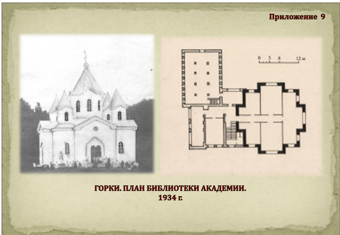
ГОРКИ. ПЛАН БИБЛИОТЕКИ АКАДЕМИИ. 1934 г.