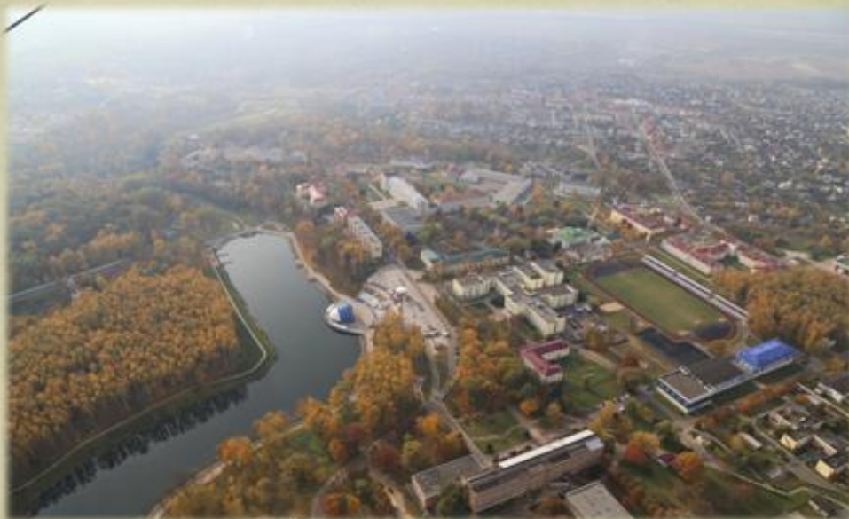
АКАДЕМИЧЕСКИЙ ГОРДОК С ВЫСОТЫ ПТИЧЬЕГО ПОИСТА 2015 год