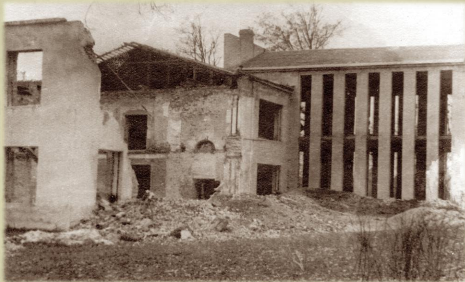
ГОРКИ. ЗДАНИЕ РАЗРУШЕННОЙ БИБЛИОТЕКИ АКАДЕМИИ