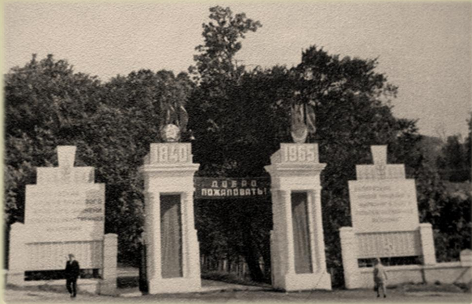
ГЛАВНЫЙ ВХОД НА ТЕРРИТОРИЮ АКАДЕМИЧЕСКОГО ГОРОДКА Архитекторы Г. Парсаданов и Д. Санников. Построен в 1953 году