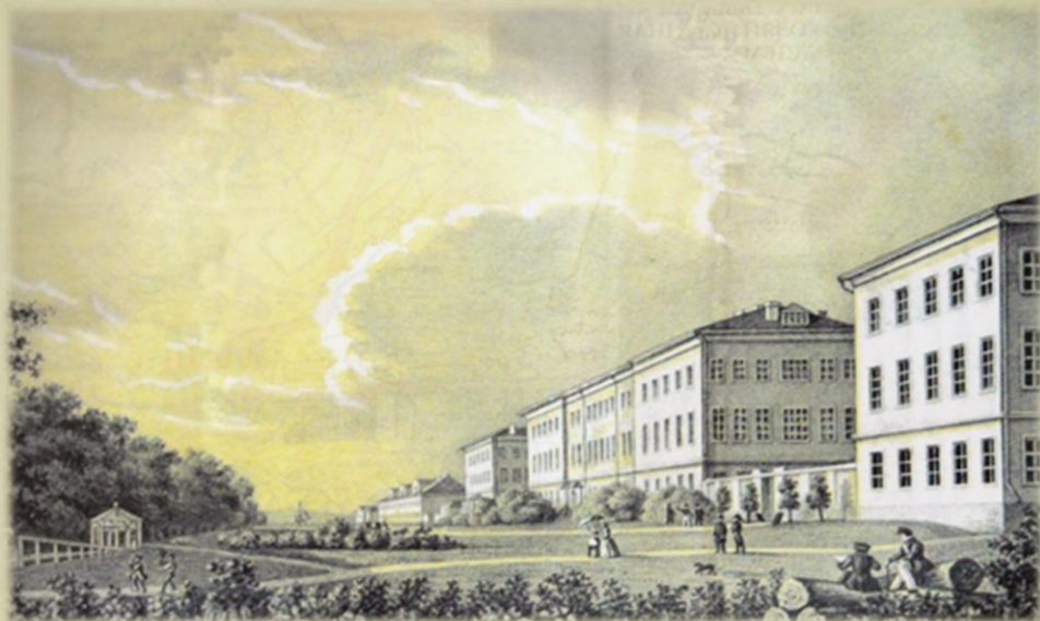
АРХИТЕКТУРНЫЙ АНСАМБЛЬ ГОРЬГОРЕЦКОГО ЗЕМЛЕДЕЛЬЧЕСКОГО ИНСТИТУТА