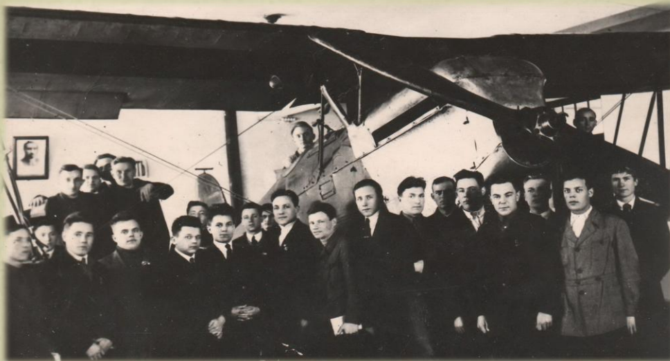
УЧЕБНЫЙ САМОЛЕТ УСТАНОВЛЕННЫЙ В ПЕРВОМ УЧЕБНОМ КОРПУСЕ Занятия вели летчики-инструкторы Оршанского авиаклуба. Школу посещали 45 человек. Фото 1940 год