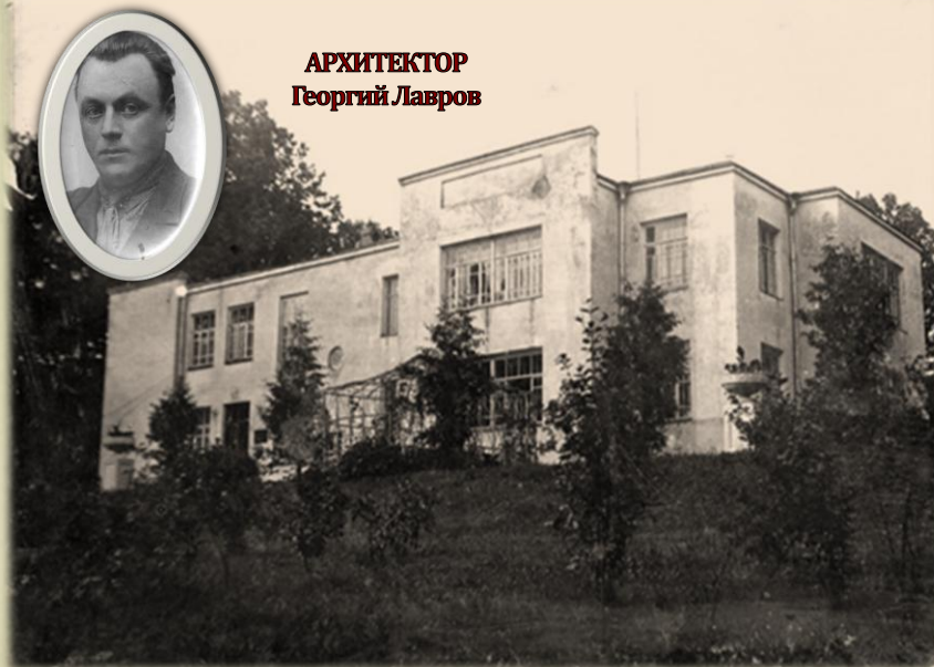
Здание церкви было перестроено под библиотеку в стиле конструктивизма архитектором Г. Лавровым в 1934 году